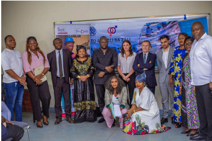
Photo : Signature du partenariat avec l'Institut National de Préparation Professionnelle - République démocratique du Congo

C'est dans cette articulation que se construisent des parcours d'insertion plus durables et plus inclusifs.