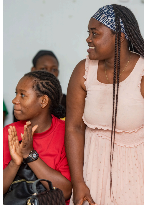
Apprenantes à la Masterclass de Douala - Cameroun

Animée par Armelle Touko , entrepreneure primée à l'international, cette rencontre a offert aux participantes un témoignage inspirant et concret sur les étapes clés de la création d'entreprise, depuis l'émergence de l'idée jusqu'à la mobilisation de financements. À travers son expérience, la consultante a partagé des stratégies pratiques notamment en matière de structuration de projet, de développement de réseau et d'accès aux financements tout en abordant les défis spécifiques auxquels font face les femmes entrepreneures, tels que l'accès limité aux ressources, les contraintes socioculturelles ou encore le manque de visibilité. Rythmée par des échanges interactifs, la session a permis aux apprenantes de renforcer leurs connaissances, de poser leurs questions et de se projeter dans leurs propres parcours entrepreneuriaux.