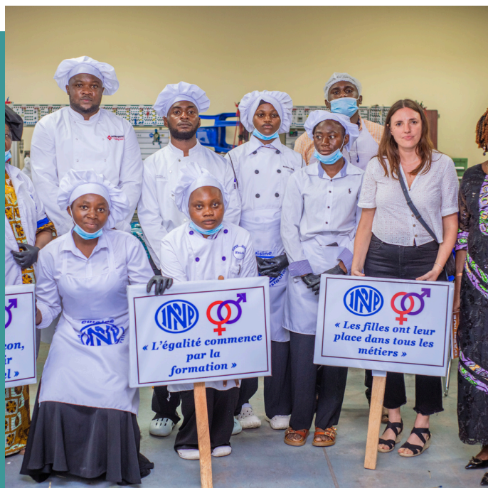
Signature du partenariat à l'Institut National de Préparation Professionnelle à Kinshasa - République démocratique du Congo

Les participantes ont particulièrement été marquées par les modules axés sur la connaissance de soi, notamment la révélation des talents, l'identification des forces et le développement de la confiance en soi. Les échanges, les travaux de groupe et témoignages ont contribué à renforcer leur motivation et à les aider à mieux se projeter dans leur avenir professionnel.