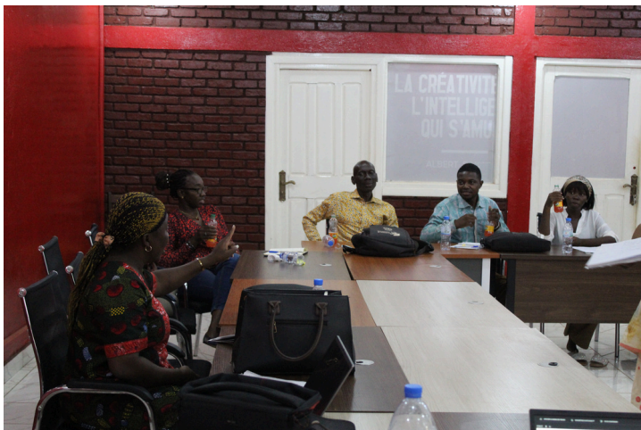
Photo : Formation à la Formation Humaine à Bangui, République centrafricaine.