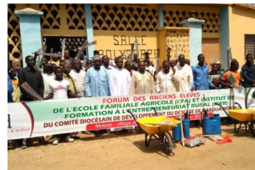
Forum des anciens élèves à Mokolo, Cameroun