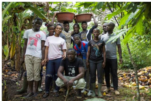
Elèves d'Afféry en visite d'étude au sein de la plantation de cacao de l'entreprise SACO, Côte d'Ivoire