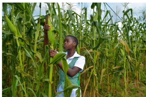
Elève dans le champs de maïs du centre de formation de Dizangué, Cameroun