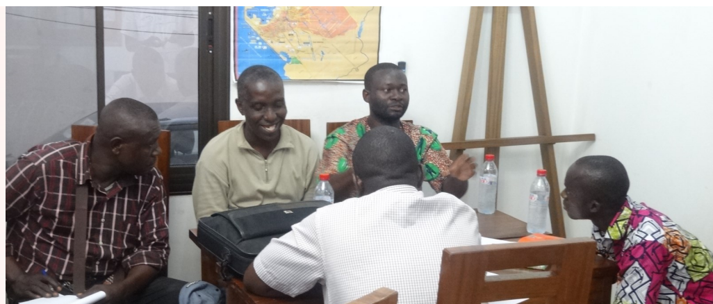
Soirée « Bimoko Ya Kisalu »

Un partenariat réussi est un partenariat qui se noue dans la durée : avant de se lancer dans l'aventure, CGED accompagne les entrepreneurs à découvrir ce qui est le plus important pour eux et l'avenir de leur entreprise. Cela leur permet d'identifier avec qui ils pourront travailler durablement.