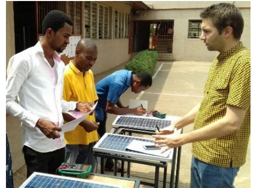
Formation technique des formateurs sur l'énergie solaire

L'IECD Nigeria a récemment mené une formation technique sur l'énergie solaire et le logiciel de dessin électrique pour les professeurs des écoles Don Bosco Onitsha et Akure. Parallèlement, leur programme de formation est en cours de mise à jour et plusieurs nouveaux outils et équipements électriques ont été acquis. Ces activités permettront d'augmenter le nombre de spécialisations et d'adapter la formation aux besoins actuels des entreprises, offrant ainsi aux étudiants plus de possibilités d'emploi et de stages.