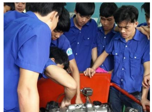
Etudiant en maintenance automobile du Thu Duc College of Technology

Le programme Graines d'Espérance a été lancé au Vietnam en fin d'année dernière. Il s'adressera à des jeunes de 15 ans et plus, en formation professionnelle dans les domaines de l'électricité résidentielle et industrielle ainsi que de la maintenance automobile. Les deux premières écoles partenaires ont déjà été identifiées : le Thu Duc College of Technology et le HCM Technical and Economy College. Le projet entre maintenant dans une phase de diagnostic afin d'adapter les activités aux besoins concrets de chaque école partenaire.