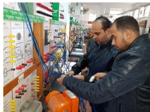
Formation des formateurs à l'Institut de Don Bosco Alexandrie