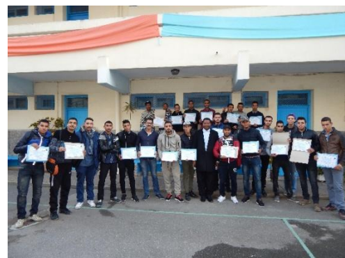
Remise des diplômes à la JUK SPEL, promotion 2016