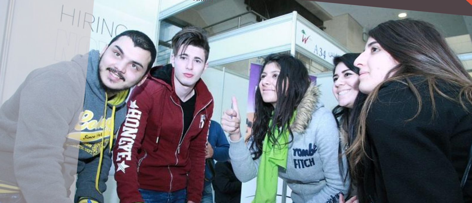
Lors du forum 2017 d'orientation et d'emploi de Tripoli (Liban)