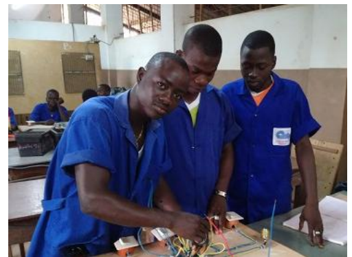
Atelier de travail au CPAR

En décembre, une convention de partenariat a été signée avec le CPAR, un centre de formation situé à Duékoué et qui recense 206 élèves. Depuis, les formateurs d'électricité ont bénéficié d'une première formation technique. Les élèves ont quant à eux assisté à une conférence sur la motivation et participé à un atelier de travail sur la recherche d'emploi. L'IECD a également rencontré les parents pour les sensibiliser à l'importance de la formation technique.